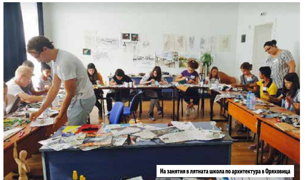
На занятия в лятната школа по архитектура в Оряховица